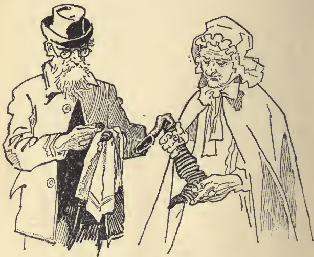
A hadikölcsön. Előkerülnek a takarékbetétek

... Egyebe nem volt, csak fejének arany-éke. Azt áldozta hát föl a névtelen, szürke kis tanítónő.