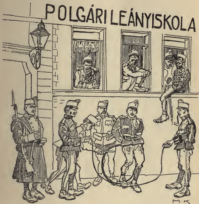
Bekvártélyozás a fővárosi iskolában.

igaza is van. Ezek a pofozógépek igazán fölöslegesek volnának. A pofozást most elvégzi derék hadseregünk ott a színhelyen, Szerbiában.