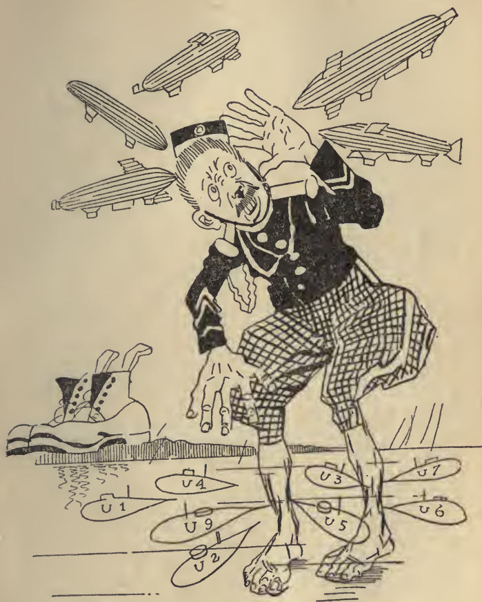
Szorul az angol