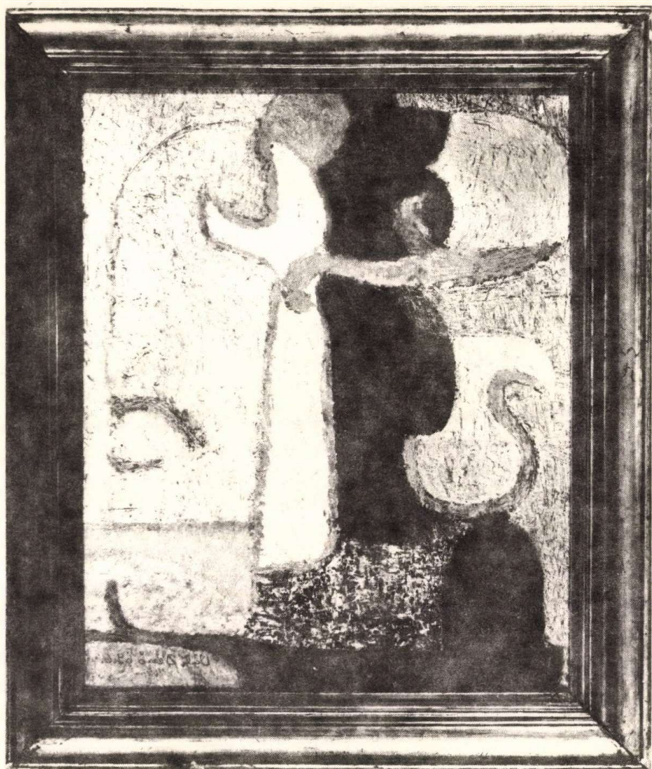
Váli Dezső: Angyali üdvözet