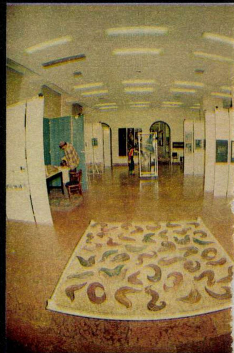
Bukta Imre: Villanypásztor