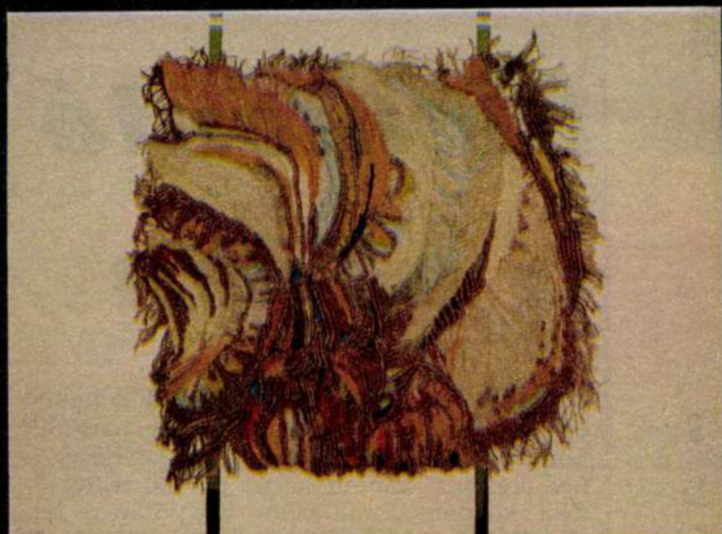
Erdős Júlia: Textilkompozíció