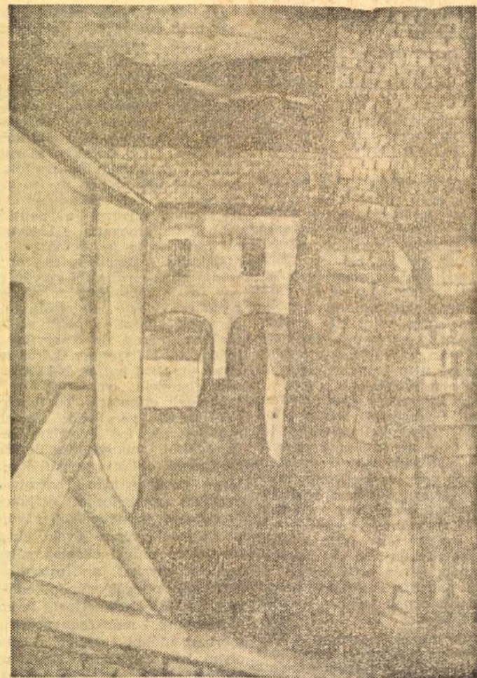
Dési-Huber István: Gyárképmény.