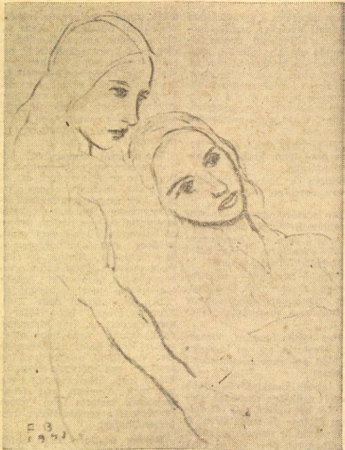
Ferenczy Béni: Két kislány